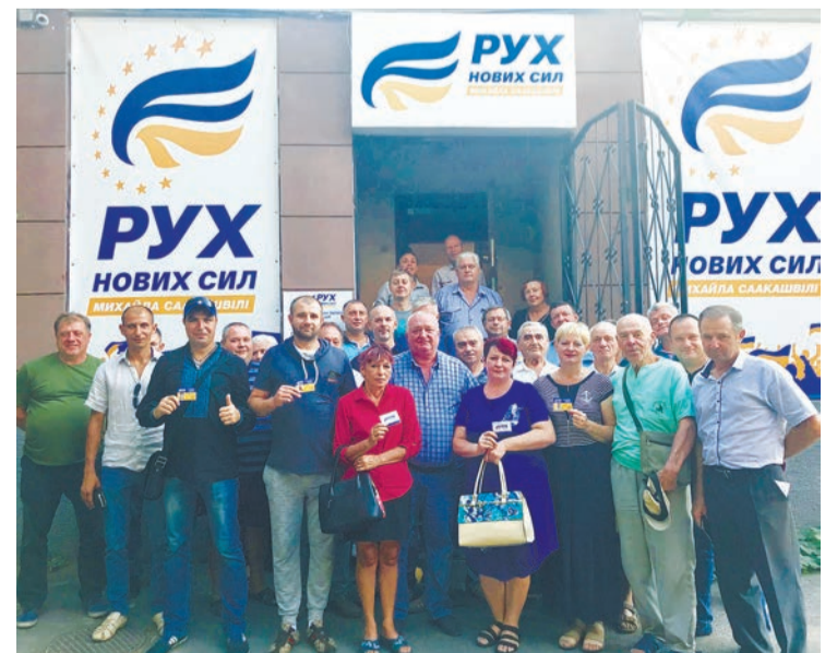
Лави Руху нових сил зростають.